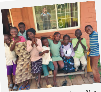
Die Kinderschar im Haus Alpa

? Wie ist eure Beziehung zu euren unmittelbaren muslimischen Nachbarn?