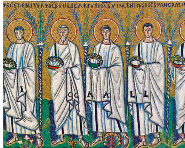
Mosaikfries Zug der Hlg. Märtyrer in San Apollinare Nuovo, Ravenna, frühes 6. Jahrhundert

12. Mit der Parusie Christi, auf die seine Gemeinde hoffnungsfroh wartet, ist die Sendung seiner Kirche auf Erden erfüllt. Ihre Bedrängnis, ihre Verfolgung und ihr Martyrium finden nicht nur ein Ende. Sie werden vielmehr überstrahlt von der völlig offenbar werdenden Herrlichkeit und heilsamen Gegenwart Gottes, der seine treuen Zeugen belohnt und dem dann das ungehinderte Gotteslob gelten wird. ■