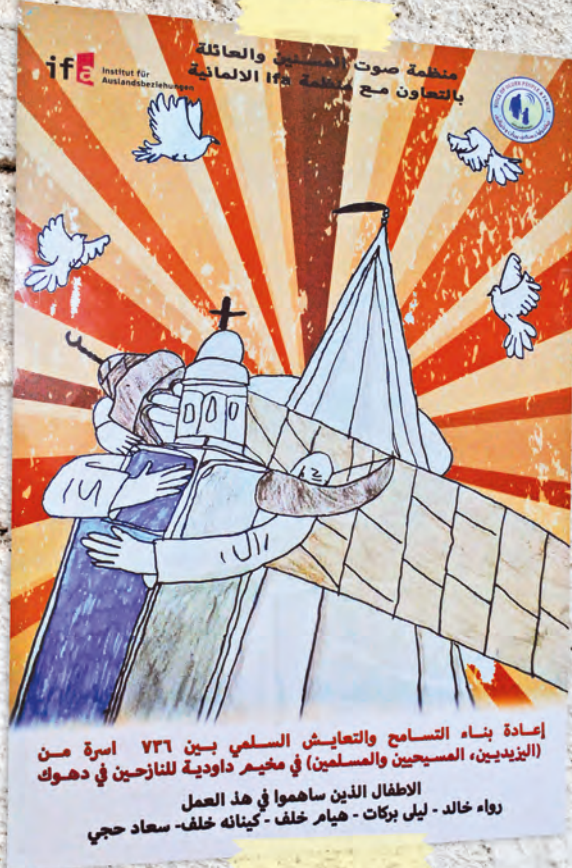
Zeichnung eines jugendlichen Flüchtlings im Camp: Die drei Konfessionen versöhnen sich (Kirche, Moschee, Jesidentempel)

gegen den Irak und eines von Saddam Hussein gegen Kurdistan erschwerten die Arbeit sehr. Zwar hatten die Leute nun die Möglichkeit, in ihre Dörfer zurückzukehren, um sie wieder aufzubauen, es standen ihnen aber keinerlei Mittel zur Verfügung. Von Anfang an war unser Motto: Die Hoffnung lebendig halten! Wir haben Häuser, Kirchen, Schulen, Bewässerungsanlagen gebaut. Aus zuerst lebensrettenden Maßnahmen wurden allmählich nachhaltige Programme, die notwendiger sind denn je.